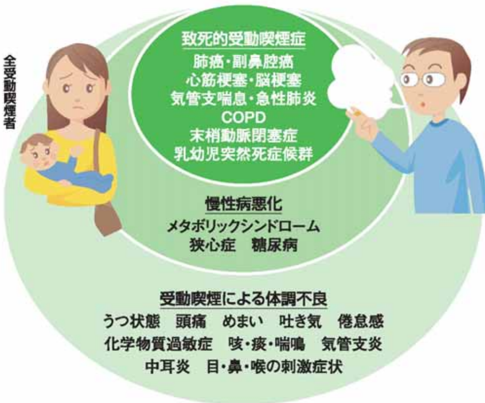
【図1】受動喫煙症の分類

究から、配偶者がタバコを吸う場合や職場で受動喫煙を受けていると肺がんになりやすいことがわかっています。受動喫煙でも動脈硬化を起こして心筋梗塞や脳梗塞になりやすくなります。その他、気管支喘息、COPD（慢性閉塞性肺疾患 ※詳しい解説は4ページ）などのリスクを増やし、糖尿病、メタボリックシンドローム、末梢動脈閉