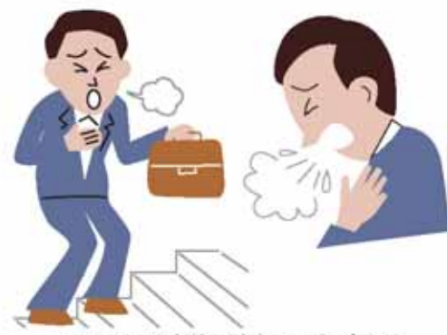
■COPDの症状／息切れ、咳、痰など