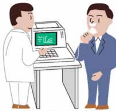
■スパイロメトリー（肺機能検査）