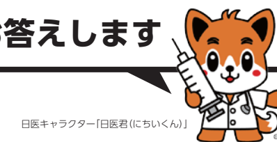
日医キャラクター「日医君(にちいくん)」